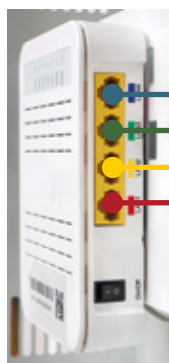
BILD 2 Tjänstefördelare

2 1 Panelplats 1 och 2 i IT-skåpet är kopplat till bredbandsuttag 1 och 2 i vardagsrummet.